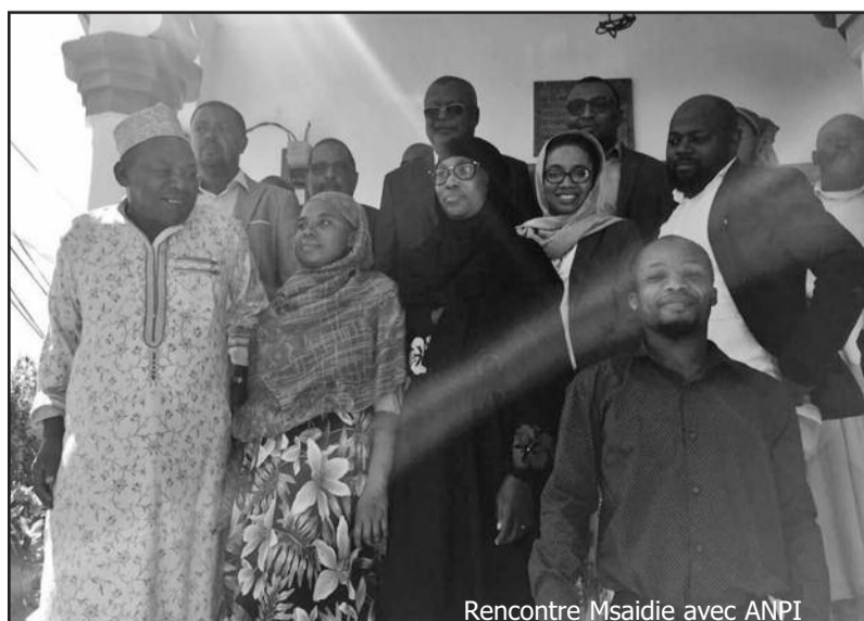
Rencontre Msaidie avec ANPI