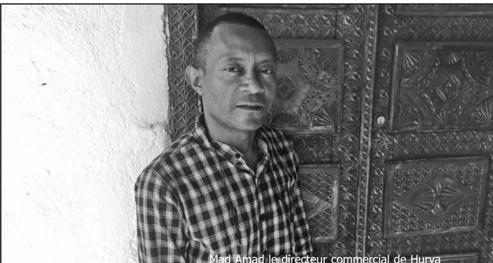
Mad Amad le directeur commercial de Hurya